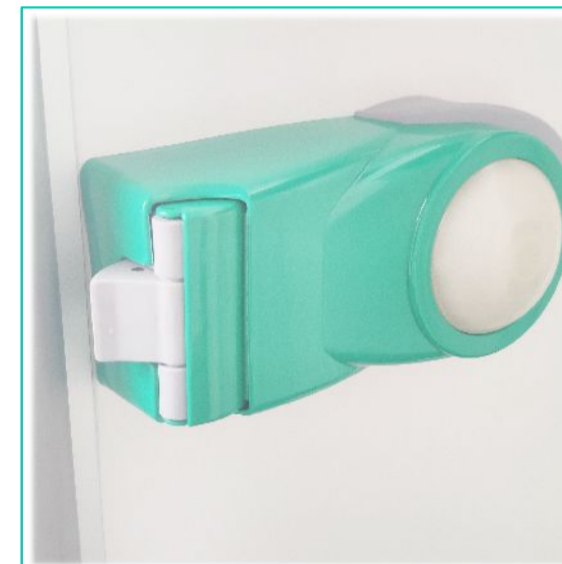
2. Belső biztonsági zár