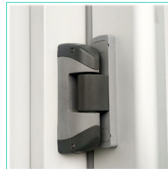
3. Kiemelős zsanérzat