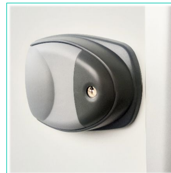
1. Külső kulcsos zár