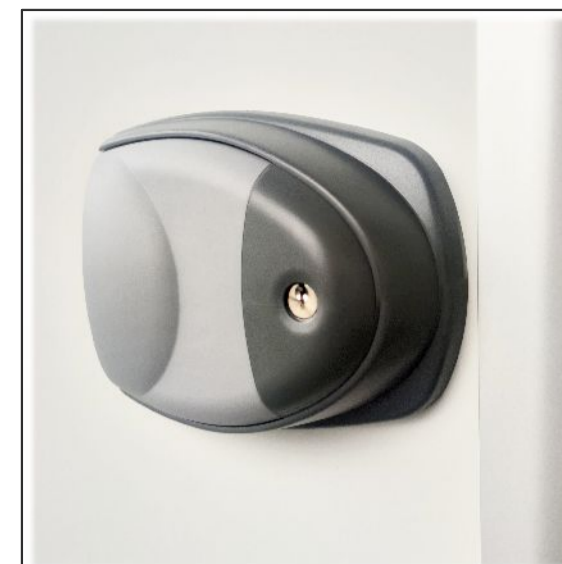
1. Külső kulcsos zár