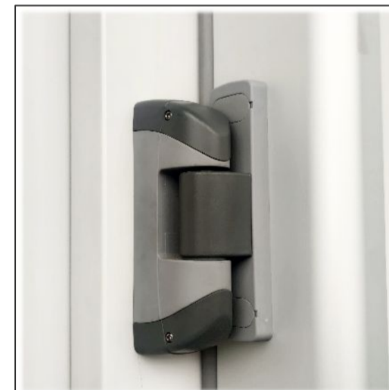
3. Kiemelős zsanérszat