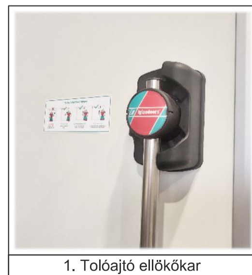
1. Tolóajtó ellökőkar

D - Ajtólap vastagsága 60 mm H - Tiszta nyílás magasság W - Tiszta nyílás szélesség P - Fogadószerkezet vastagsága 150 mm-ig ABS/PVC tokbelső 150 mm-től egyedi lemez takaró 5. IglooDoors alumínium mechanika Fogadószerkezet kivágás W+20 mm H+10 mm