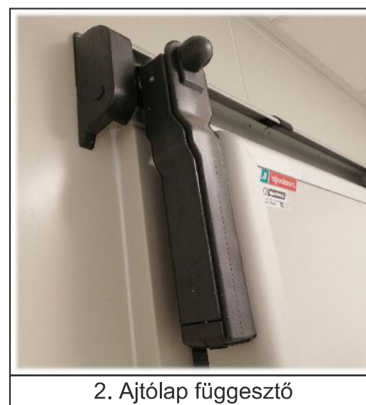
2. Ajtólap függesztő